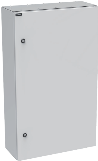
Widok z przodu