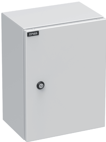
Widok z przodu