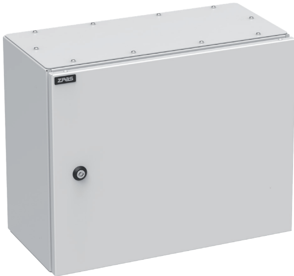
Widok z przodu