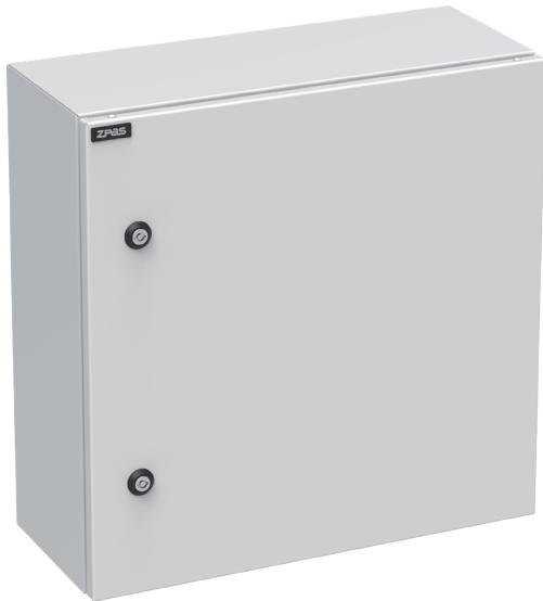
Widok z przodu