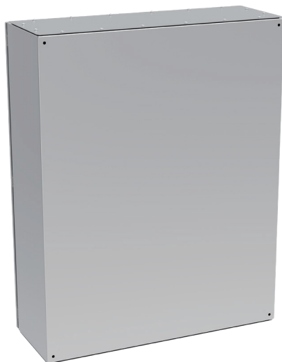
Widok z tyłu