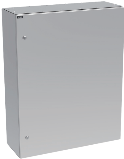
Widok z przodu

Kompaktowa szafka naścienna, przeznaczona do montażu urządzeń elektrycznych wymagających ochrony przed dostępem, zapyleniem i wilgocią. Przewidziana do zastosowania w warunkach zewnętrznych, w środowisku agresywnym korozyjnie lub tam, gdzie wymagane jest zachowanie szczególnej higieny.