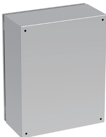
Widok z tyłu