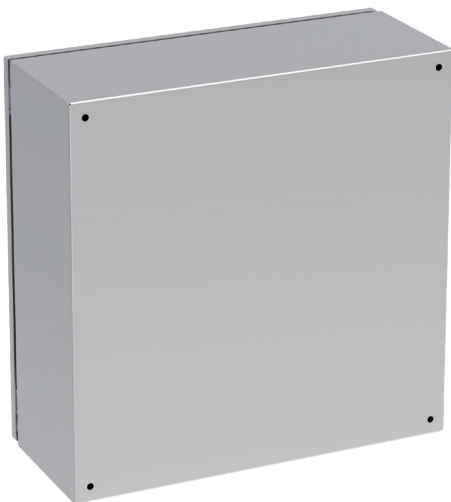
Widok z tyłu