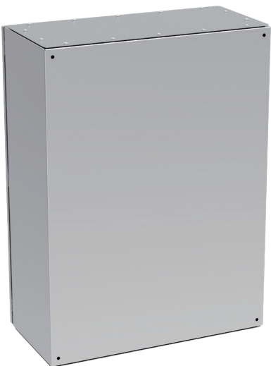
Widok z tyłu