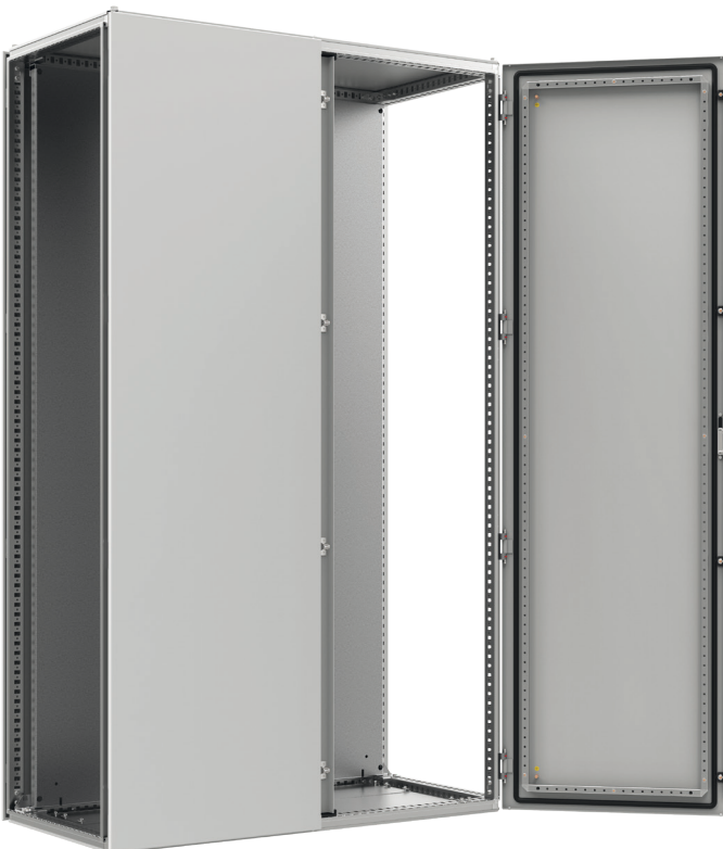
Widok z przodu, drzwi otwarte