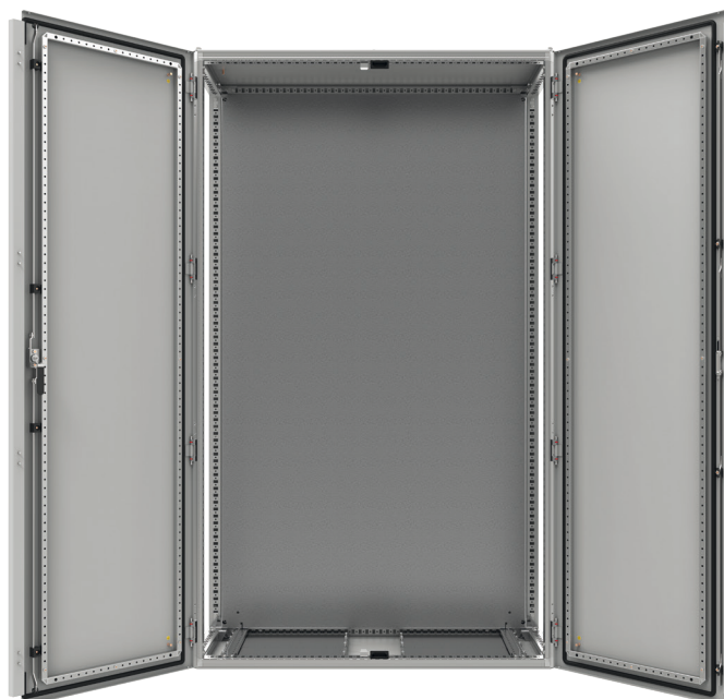
Widok z przodu, drzwi otwarte