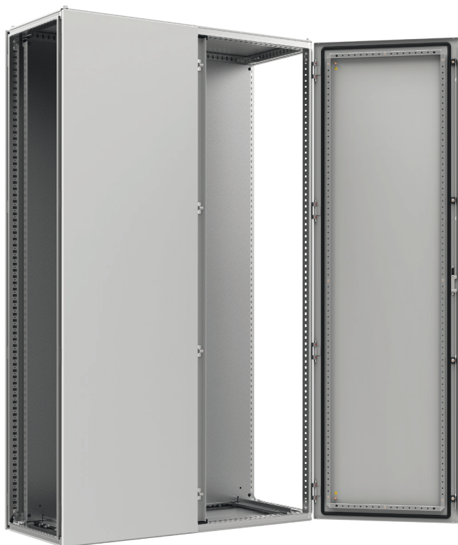
Widok z przodu, drzwi otwarte