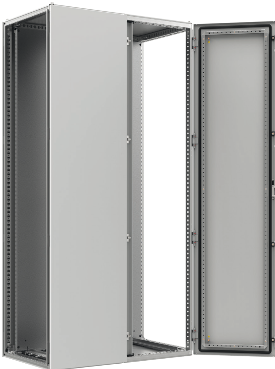
Widok z przodu, drzwi otwarte