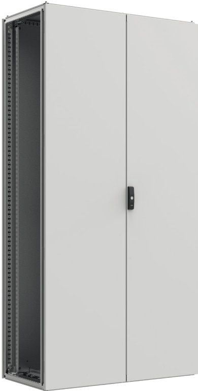
Widok z przodu