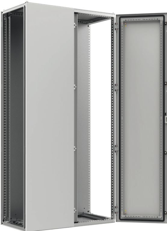
Widok z przodu, drzwi otwarte