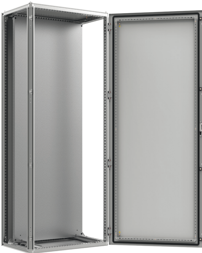
Widok z przodu, drzwi otwarte