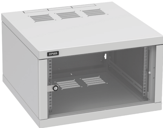
Widok z przodu