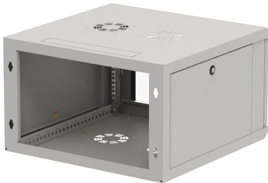
Widok z tyłu