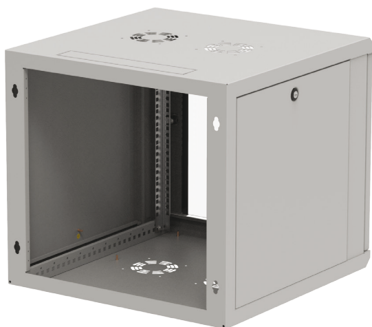
Widok z tył