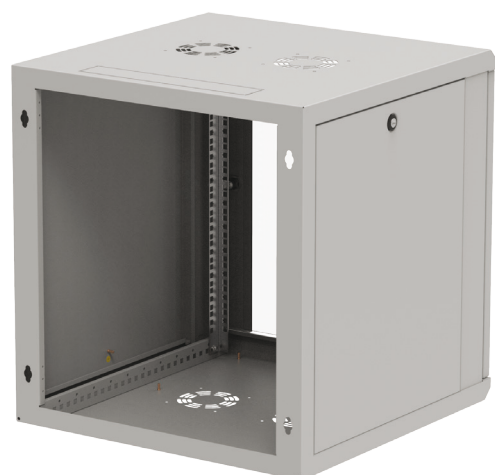
Widok z tyłu