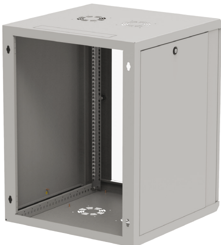
Widok z tył