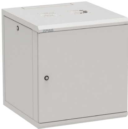
Widok z przodu