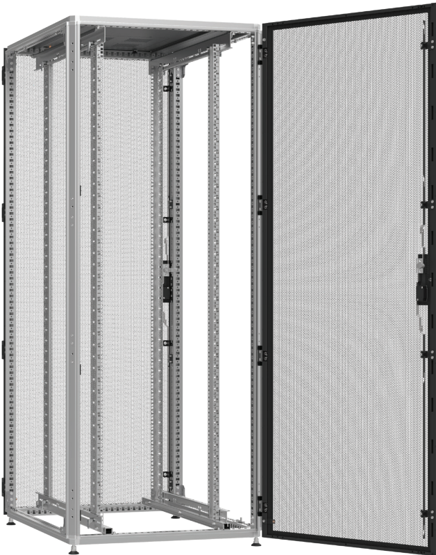
Widok z tyłu