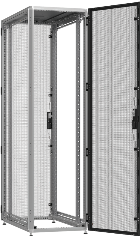
Widok z tyłu