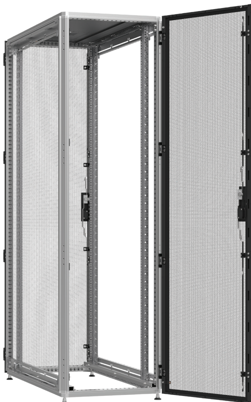
Widok z tyłu