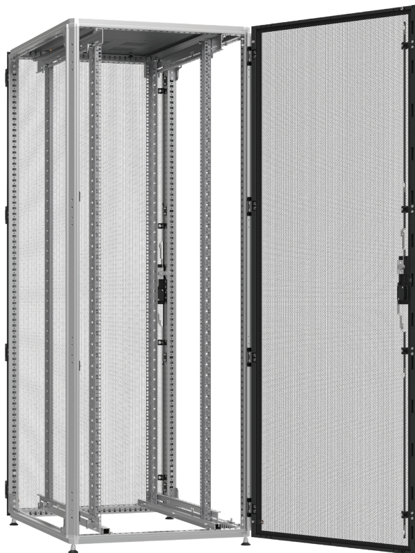
Widok z tyłu