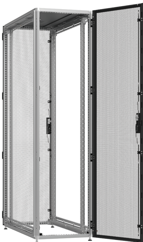
Widok z tyłu